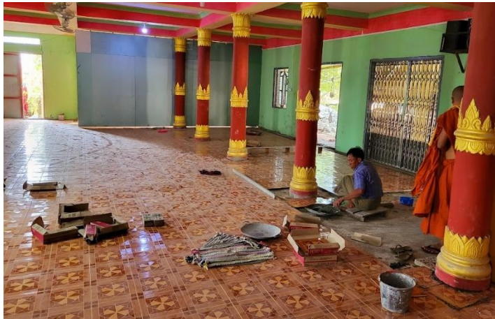
Aménagement de la future « salle de classe »