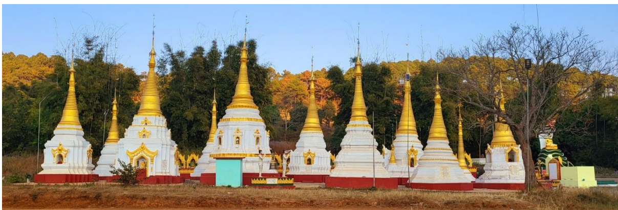
Au nord de Kalaw

Avec beaucoup de prudence et de discrétion, nous avons élargi notre programme de micro-crédits en faveur de familles paysannes, nous avons maintenu notre aide alimentaire d'urgence et nous avons mis en route la construction de deux bâtiments scolaires.