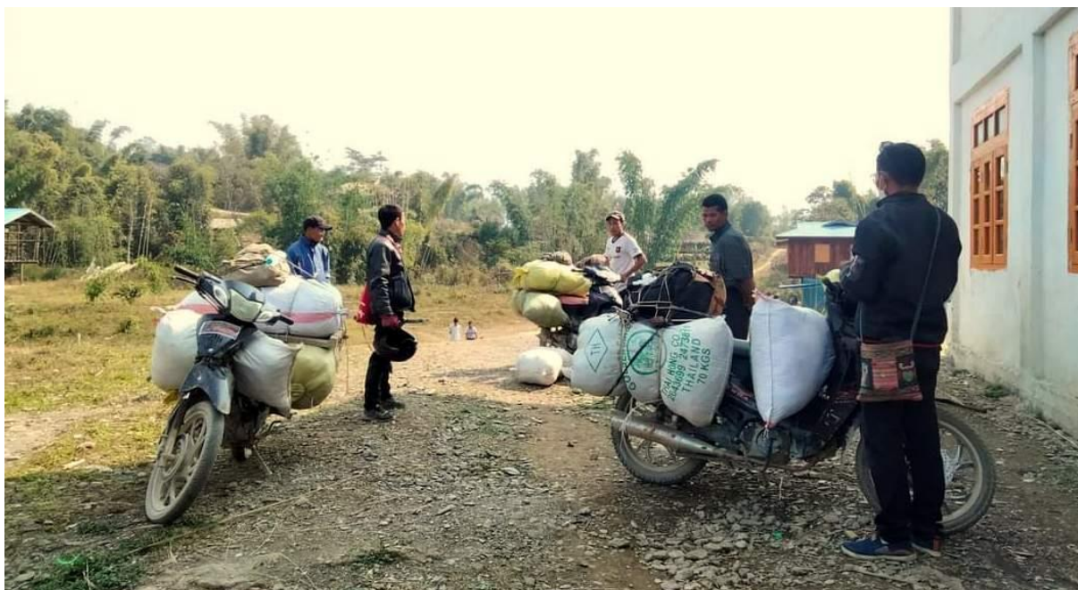
Aide alimentaire dans la région de Sagaing